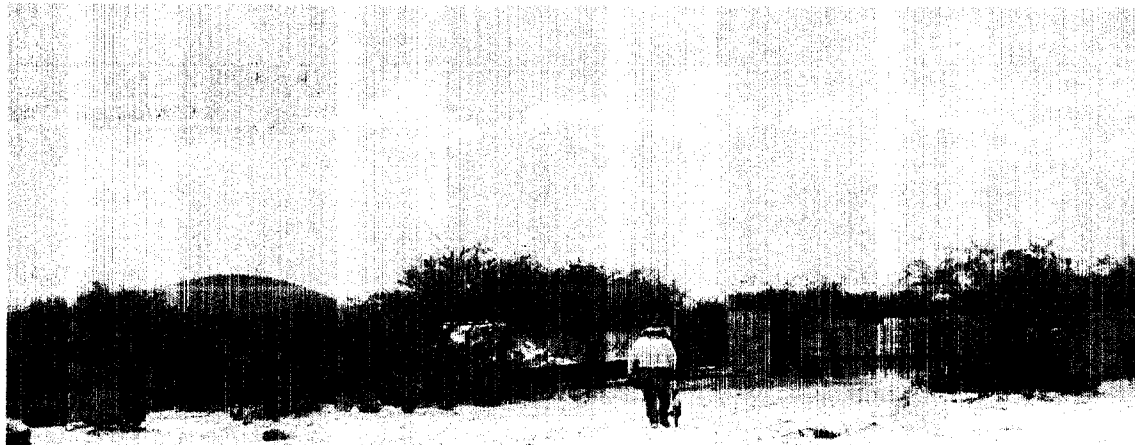
SAN IGNACIO, GUADALCAZAR, S.L.P.