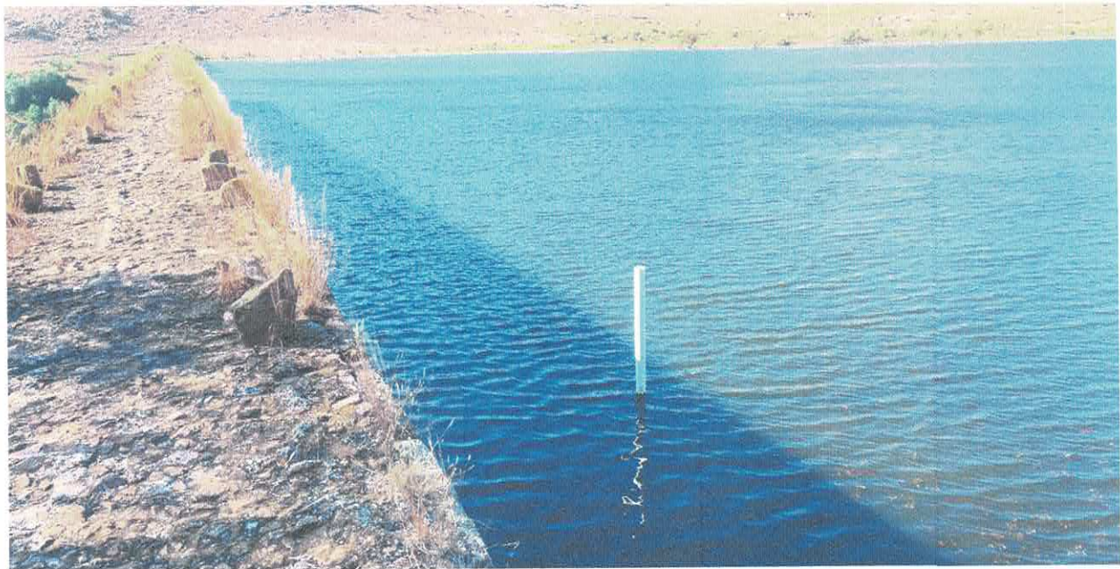
OBRA DE TOMA.